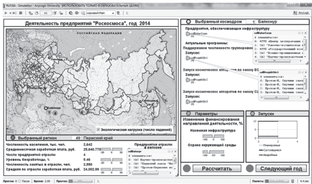
Рис. 4. Главное рабочее окно модели «RussianSpace». Блок 2, 2014 год

демографической ситуации в Евросоюзе на ближайшие десятилетия с учетом возникшего миграционного кризиса.