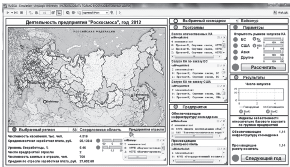
Рис. 3. Главное рабочее окно модели «RussianSpace». Блок 1

параметров образуют ограничения зарубежных заказчиков на сотрудничество в части запусков их космических аппаратов. Эти параметры вводятся в виде долей от общего запланированного заказа — отдельно для разных стран.